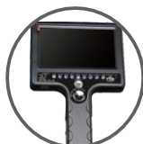
Partie de commande