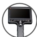
Partie de commande